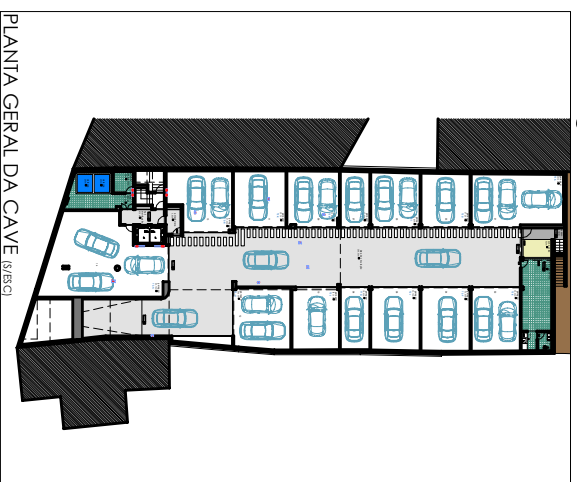
PLANTA GERAL DA CAVE (S/FSC)