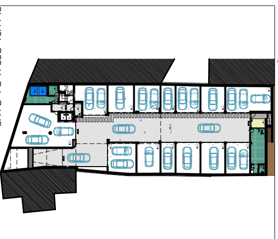
PLANTA GERAL DA CAVE (ÁREA)