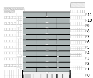
Localização em Alçado Posterior