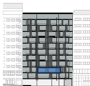
Localização em Alçado Principal